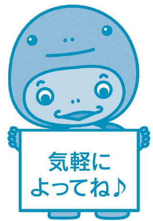
元気県ぐんまマスコットキャラクター 「GENKI(げんき)」