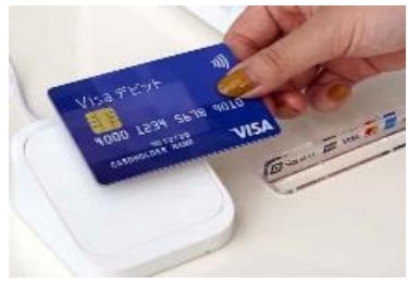
③キャッシュレス決済環境の整備