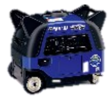
①非常用電源装置の整備