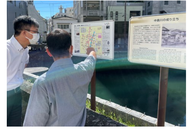
④専門家による現地調査