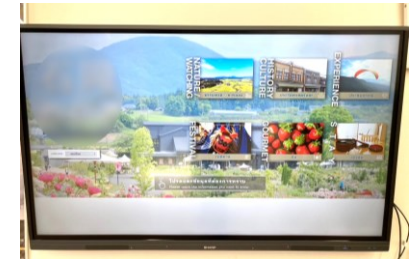
②デジタルサイネージの整備