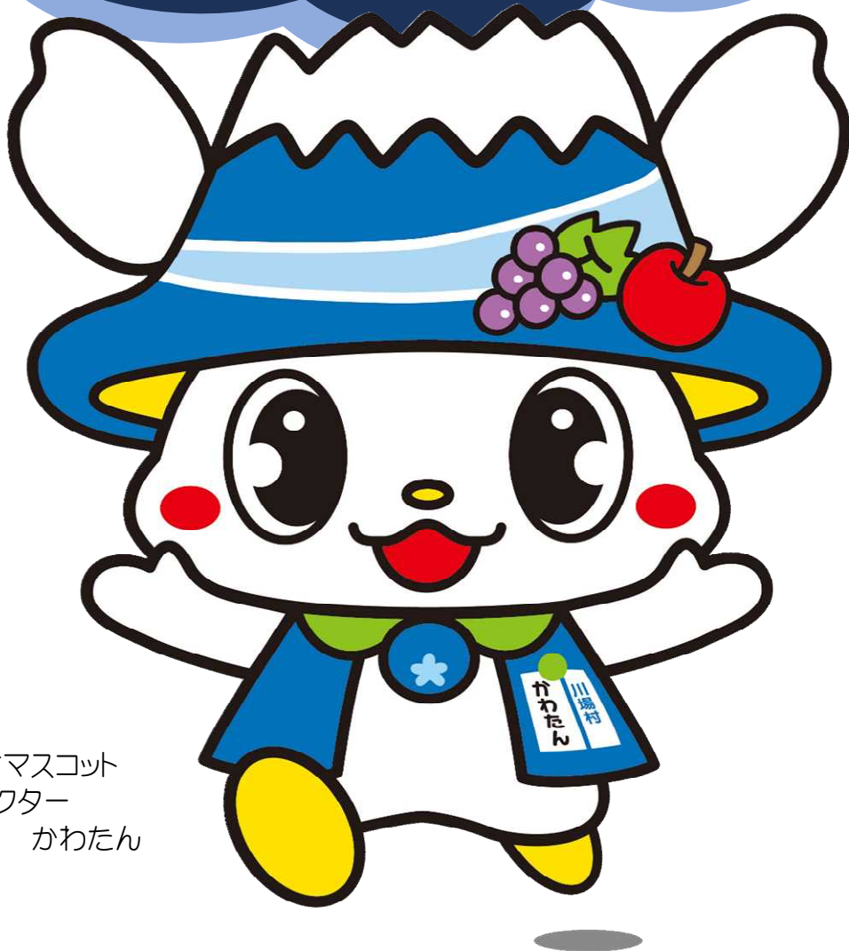
川場村マスコット キャラクター かわたん