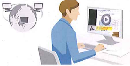
インターネット環境